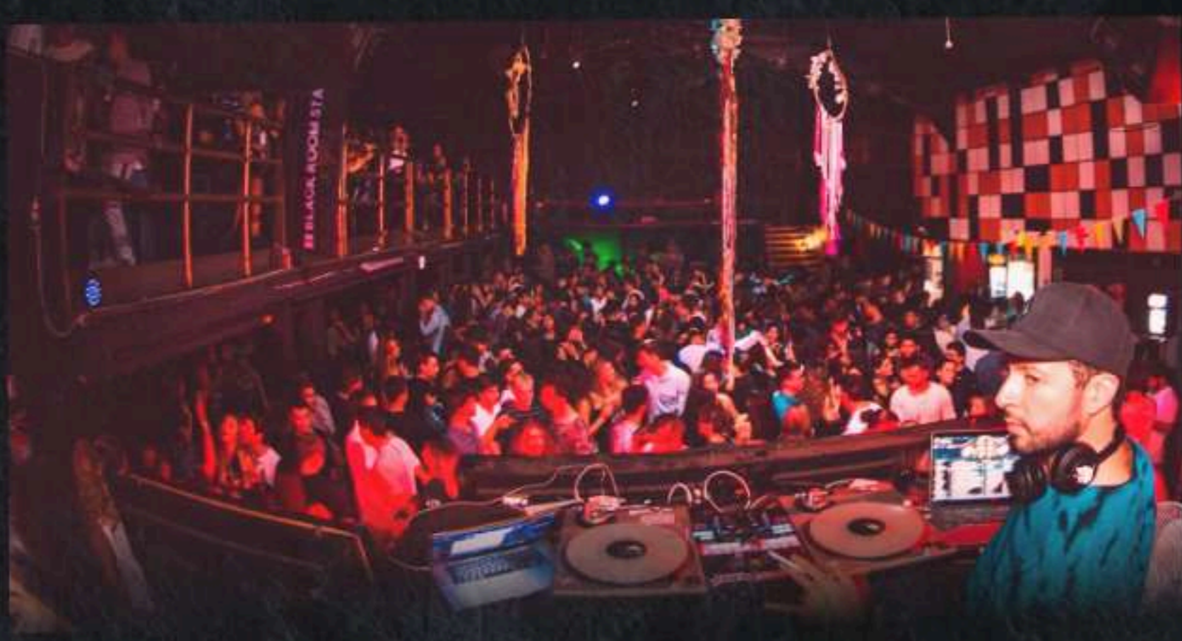
BLACK ROOM STAGE

Evento exclusivo para estudiantes y acompañantes en "Black Room Stage"