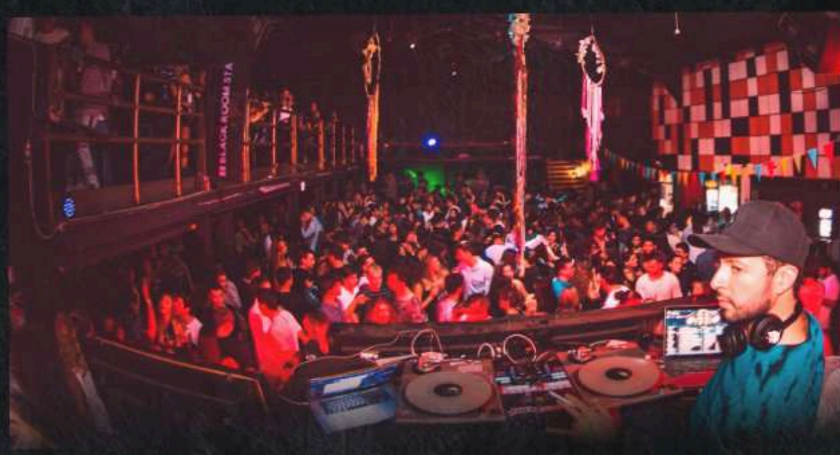
BLACK ROOM STAGE